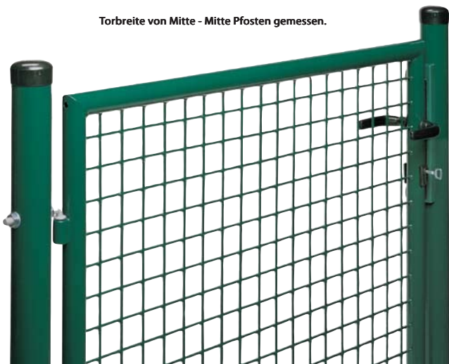
Torbreite von Mitte - Mitte Pfosten gemessen.

FEUER VERZINKT komplett feuerverzinkt, Alu-Drückergarnitur, Schrauben und Muttern aus Edelstahl.