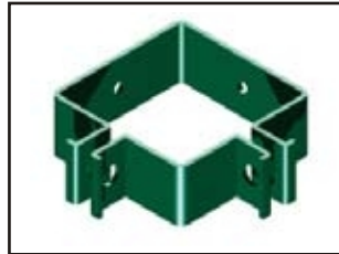
Eckschelle - 90° für Mittelpfosten