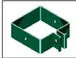
Endschelle für Endpfosten